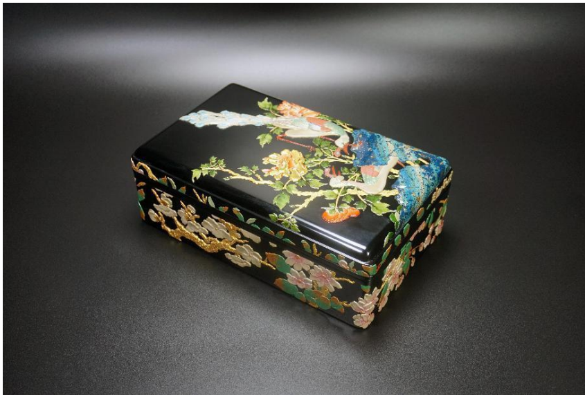
大漆作品彩绘描金华焕长方文盒