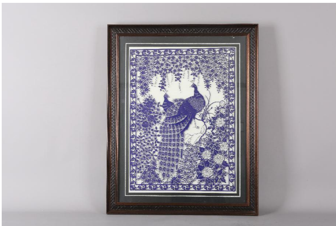
堰兴剪纸作品：繁荣昌盛（蓝）