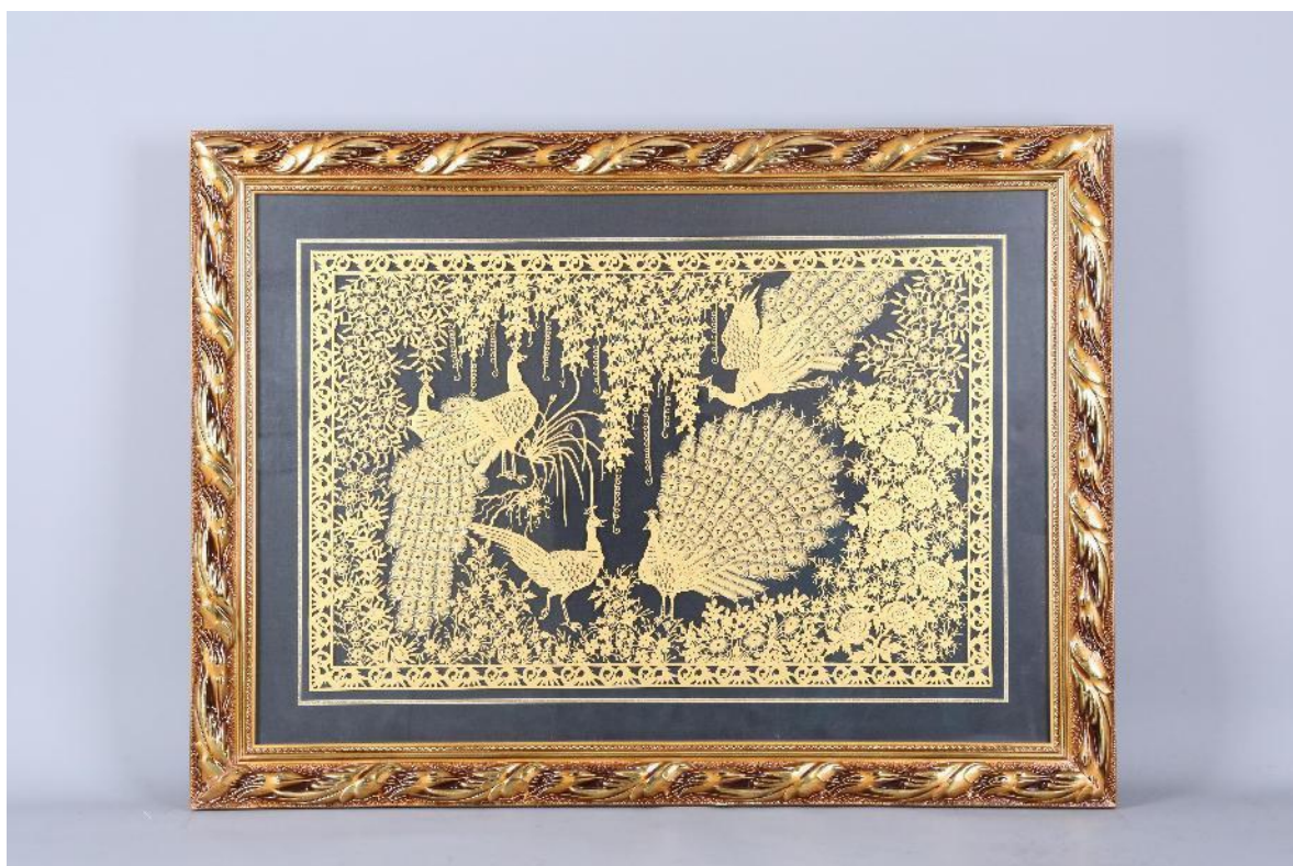
堰兴剪纸作品：锦羽争妍